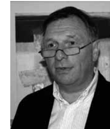
Claude Wey , Historiker, Präsident der Cellule de Recherches sur la Résolution de Conflits (C.R.R.C.) des Minis- teriums für Kultur, Hochschulbildung und Forschung, Luxemburg. > 20 min.